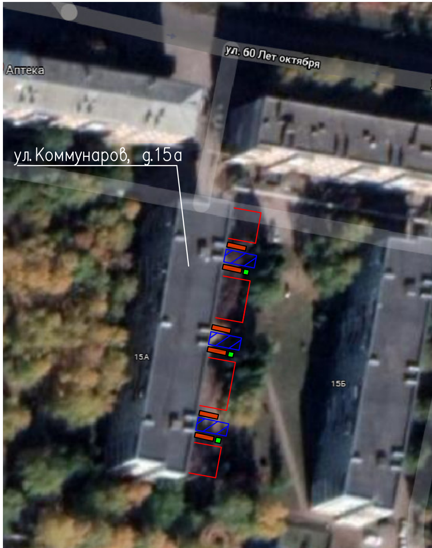
г.п.Петра Дубрава, п. Петра Дубрава