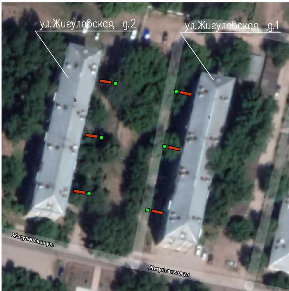
с. п. Курумоч, с. Курумоч

Проектом предусматривается благоустройство территории с. Курумоч, ул. Жигулевская, д.1, д.2, которое включает в себя: – установка скамеек; – установка урн.