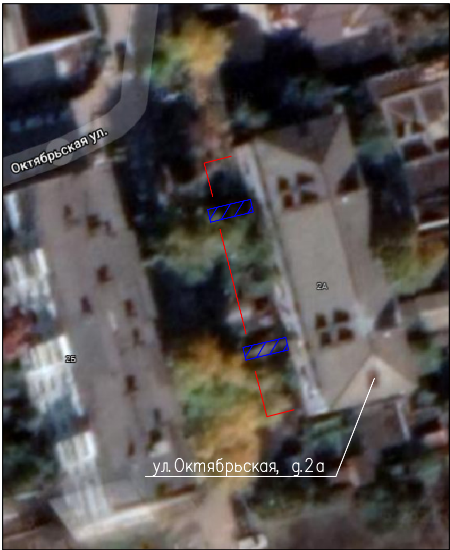
г. п. Смышляевка, пгт. Стройкерамика

Проектом предусматривается благоустройство территории пгт. Смышляевка, ул. Октябрьская д. 2а, которое включает в себя: – устройство асфальтового покрытия входов в подъезды; – ограждение газонов.