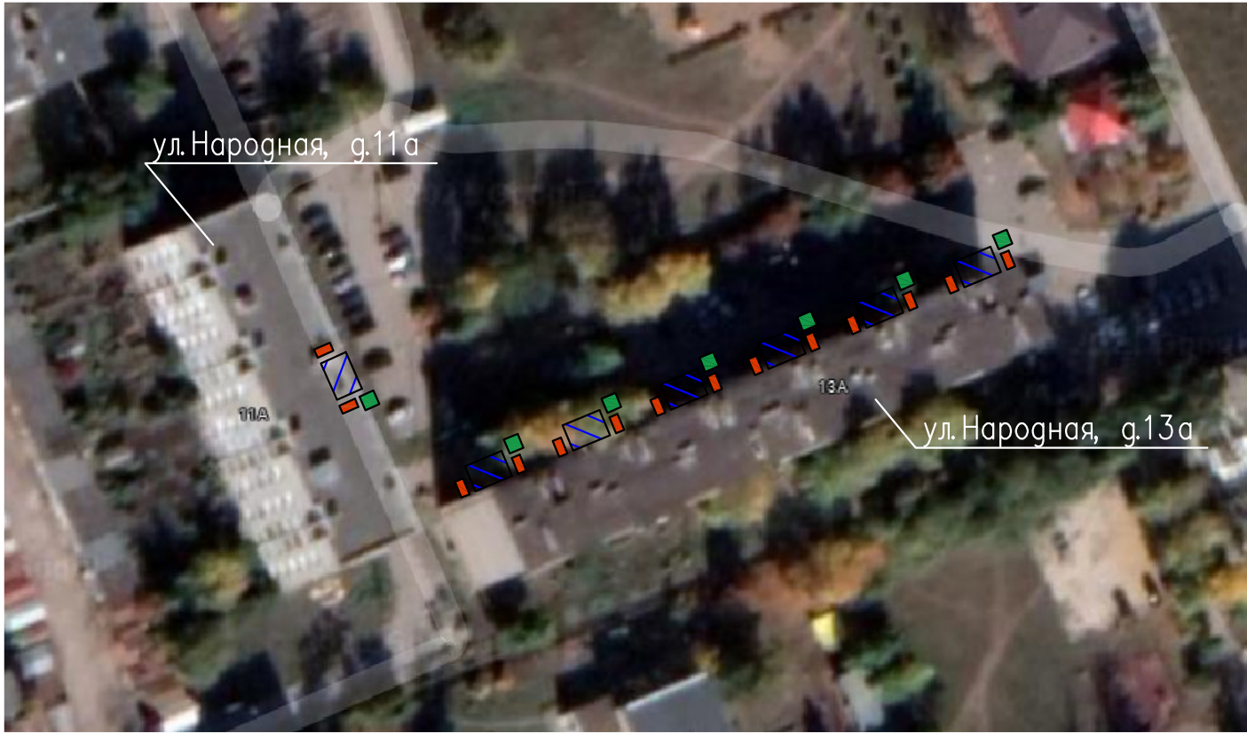
г.п. Смышляевка, пгт Стройкерамика

Проектом предусматривается благоустройство территории пгт. Строкерамика, ул, Народная, д.11а, д.13а которое включает в себя: – устройство асфальтового покрытия входов в подьезды; – установка урн; – установка скамеек.